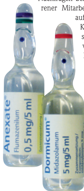
Abb. 2: Zum Verwechseln ähnlich: sogenannte „Look alike“