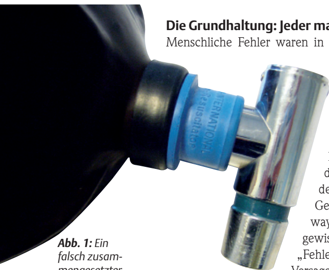
Abb. 1: Ein falsch zusammengesetzter Beatmungsbeutel. Heute durch konstruktive Maßnahmen kaum noch möglich