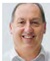
Styger, Urs, 1958 di Ebikon (LU) e Rothenturm (SZ), a Ebikon

Studi di Medicina (Università di Berna) con laurea. Formazione continua, tra le altre nel Nord-America. Dal 1985 al 1990 specializzazione in cliniche e ospedali svizzeri. Dal 1996 in funzione responsabile presso l'Ospedale universitario di Zurigo; dal 1999 al 2009 direttore della Clinica e Policlinica per Medicina fisica e Riabilitazione e nel Comitato direttivo dell'Istituto per Scienze della salute e riabilitazione presso l'Università Ludwig-Maximilian di Monaco di Baviera. Direttore e titolare della cattedra di Scienze e Politica della salute dell'Università di Lucerna. Direttore dell'ICF Research Branch WHO. Foreign Associate dell'Institute of Medicine of the National Academies, USA, membro di numerosi collegi di discipline specialistiche.