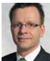
Regener, Helge, MME, 1969 di cittadinanza tedesca, a Wikon (LU)

Anna (Lucerna), medico condotto e sostituto del medico delegato e del medico cantonale fino al 2002. Dal 1990 al 2002 anche medico consulente in Pneumologia per il CSP e dal 2002 al 2012 attività di primario dell'Ambulatorio CSP. Presidente della SA Ventilazione a domicilio della Società svizzera di Pneumologia e vice-presidente della Società svizzera di Medicina subacquea e iperbarica (SUHMS). Presidente della OLSA (Organizzazione dei medici dirigenti d'ospedale del Cantone di Lucerna). Membro della Società svizzera di Pneumologia, della European Respiratory Society e Fellow dell'American College of Chest Physicians.