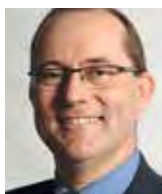
Stucki, Gerold, Prof. Dr. med., 1959 di Diemtigen (BE) e Kriens (LU), a Eich (LU)

Istruttrice diplomata di sci, attività per scuole di sport invernale. Poi casalinga e madre. Atletica disabile (sci alpino) con vari successi, anche ai mondiali e alle Paralympics. Membro dell'UDC, consigliera agli Stati (2000 al 2002).