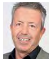
Spring, Hans, Dr. med., 1949 di Steffisburg (BE), a Leukerbad (VS)

Studi di Medicina (Università di Basilea), più tardi consegue la specializzazione in Anestesiologia e Medicina d'urgenza e intensiva. Dal 1974 al 1987 lavora in diverse cliniche sia negli USA che in Svizzera. Dal 1988 a marzo 2013 direttore del dipartimento di Anestesia e Medicina chirurgica intensiva nell'Ospedale di Basilea e ordinario di Anestesiologia e Rianimazione all'università di Basilea. Membro del Consiglio svizzero della scienza e dell'innovazione (CSSI).