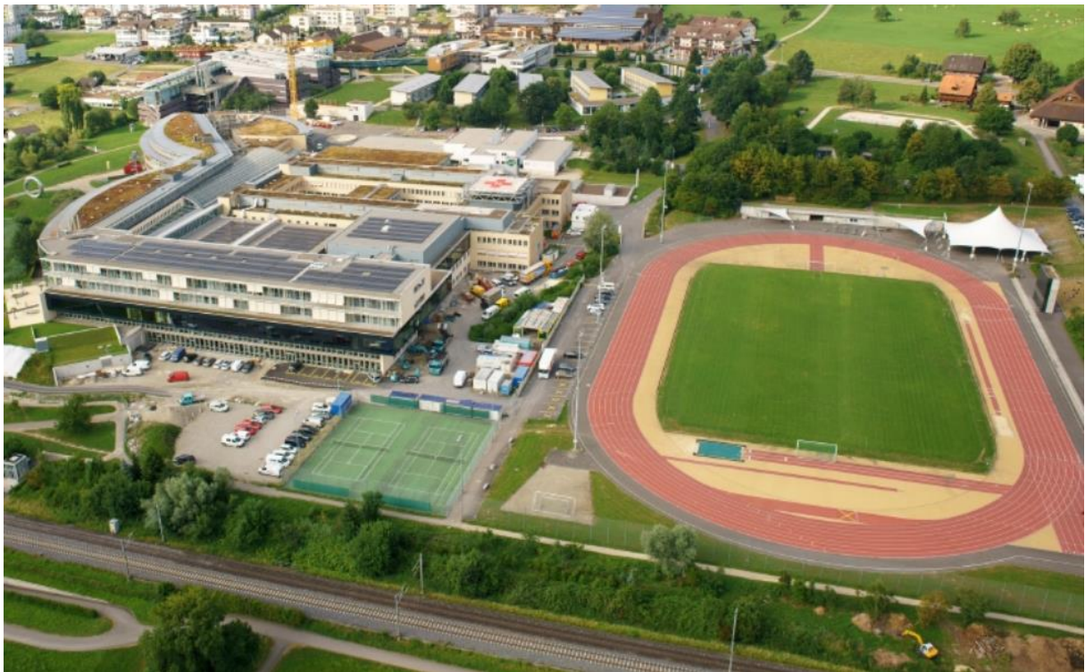
Schweizer Paraplegiker-Zentrum und Sportanlagen